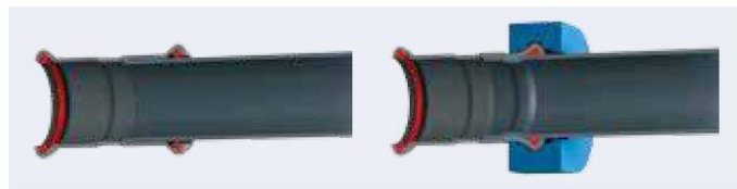
Fig. 1 – dwarse doorsnede voor en na het persen

Door de materiaaleigenschappen van de buis en de persfitting vervormen deze gelijktijdig en gelijkmatig op twee plaatsen onder inwerking van de persbekken of -kettingen van de perstang. Een eerste vervorming achter de perskraag leidt tot een trekvraste verbinding van persfitting en buis. Een tweede vervorming, vanuit drie richtingen, ter hoogte van de perskraag en dus de dichtring, leidt tot een dichte verbinding van persfitting en buis. De dwarse doorsnede (figuur 2) toont de fitting vóór en na het persen.