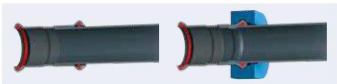
Fig. 1 dwarse doorsnede voor en na het persen

Door de materiaaleigenschappen van de buis en de persfitting vervormen deze gelijktijdig en gelijkmatig op twee plaatsen onder inwerking van de persbekken of -kettingen van de persstang. Een eerste vervorming achter de perskraag leidt tot een trekvast verbinding van persfitting en buis. Een tweede vervorming, vanuit drie richtingen, ter hoogte van de perskraag en dus de dichtring, leidt tot een dichte verbinding van persfitting en buis. De dwarse doorsnede (figuur 2) toont de fitting vóór en na het persen.